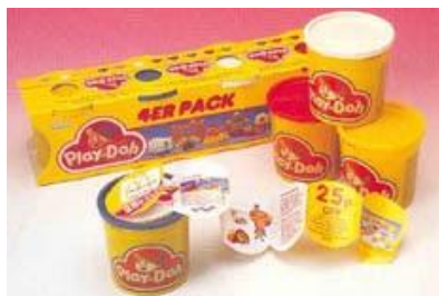
รูปภาพสิ่งพิมพ์ 3 มิติ

ส่วนสิ่งพิมพ์ 3 มิติ คือ สิ่งพิมพ์ที่มีลักษณะพิเศษที่ต้องอาศัยระบบการพิมพ์แบบพิเศษ และส่วนใหญ่จะเป็นการพิมพ์โดยตรงลงบนผลิตภัณฑ์ที่สร้างรูปทรงมาแล้ว สำหรับตัวอย่างการพิมพ์แบบ 3 มิติได้แก่ การพิมพ์สกีบนบนภาชนะต่าง ๆ เช่น แก้ว กระจก พลาสติก การพิมพ์ระบบแพดบนภาชนะที่มีผิวต่างระดับ เช่น เครื่องปั้นดินเผา เครื่องใช้ไฟฟ้า การพิมพ์ระบบพ่นหมึก เช่น การพิมพ์วันหมดอายุของอาหารกระป๋องต่าง ๆ โดยสามารถจำแนกประเภทของสื่อสิ่งพิมพ์ได้ ดังนี้