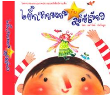
รูปภาพสิ่งพิมพ์ประเภท 2 มิติ

ในปัจจุบันสามารถแบ่งประเภทของสื่อสิ่งพิมพ์ได้มากมายหลายประเภท โดยทั้งสิ่งพิมพ์ 2 มิติ และสิ่งพิมพ์ 3 มิติ คือ สิ่งพิมพ์ที่มีลักษณะเป็นแผ่นเรียบ ใช้วัสดุจำพวกกระดาษและมีเป้าหมายเพื่อนำเสนอเนื้อหาข่าวสารต่าง ๆ เช่น หนังสือ นิตยสาร จุลสาร หนังสือพิมพ์ แผ่นพับ โบชัวร์ ใบปลิว นามบัตร แมกกาซีน พ็อกเก็ตบุ๊ก เป็นต้น