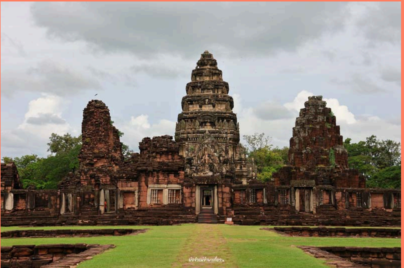
ป๋อจ๋านแม่จ๋านนาบ็ือจ๋