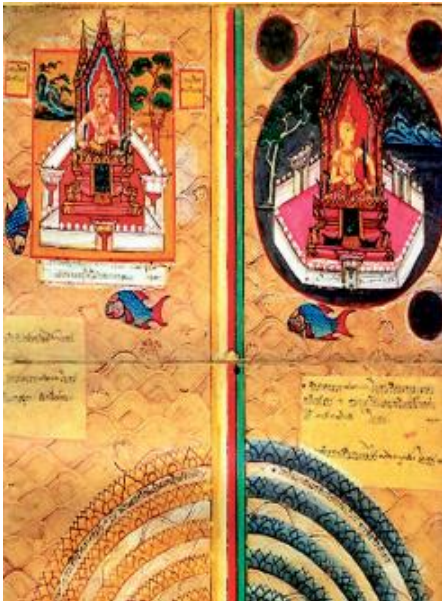
สมุดภาพไตรภูมิที่เขียนขึ้นในสมัยสมเด็จพระเจ้าตากสินมหาราช